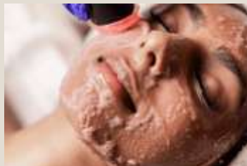
Tijdens de OxyGeneo behandeling kiezen we specifieke pods voor uw huiddoel