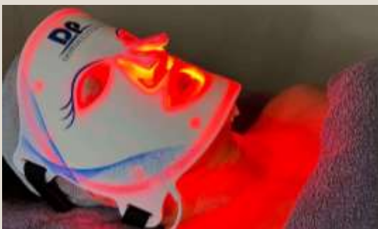
L.E.D. Mask lichttherapie sessie van Dermapen (zeer ontspannend en huidverbeterend)