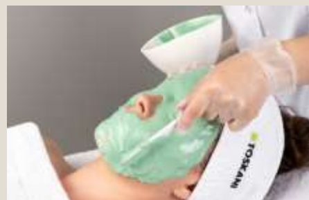
Huidverbeterend alginaat masker