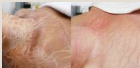
BioPulse Therapy behandeling

Het is een intensief liftende, ontgiftende en huidherstellende behandeling op basis van biochemie. Het is tevens de meest effectieve variant van zuurstoftherapie, doordat het zuurstof van binnenuit direct aan de huidcellen afgeeft!